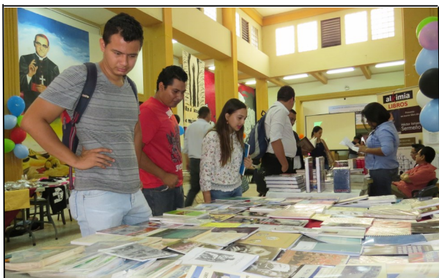
Estudiantes de Ciencias Jurídicas y RR. II. participan en la Feria del Libro

Como muestra a su dedicación y hacer uso de los servicios de la biblioteca, el equipo de trabajo de la Biblioteca “Dr. Sarbelio Navarrete”, reconoció a estudiantes con la entrega de libros de la producción que la Facultad realiza, así como un pergamino y un diploma por su espíritu de investigar y aprovechar este recurso.