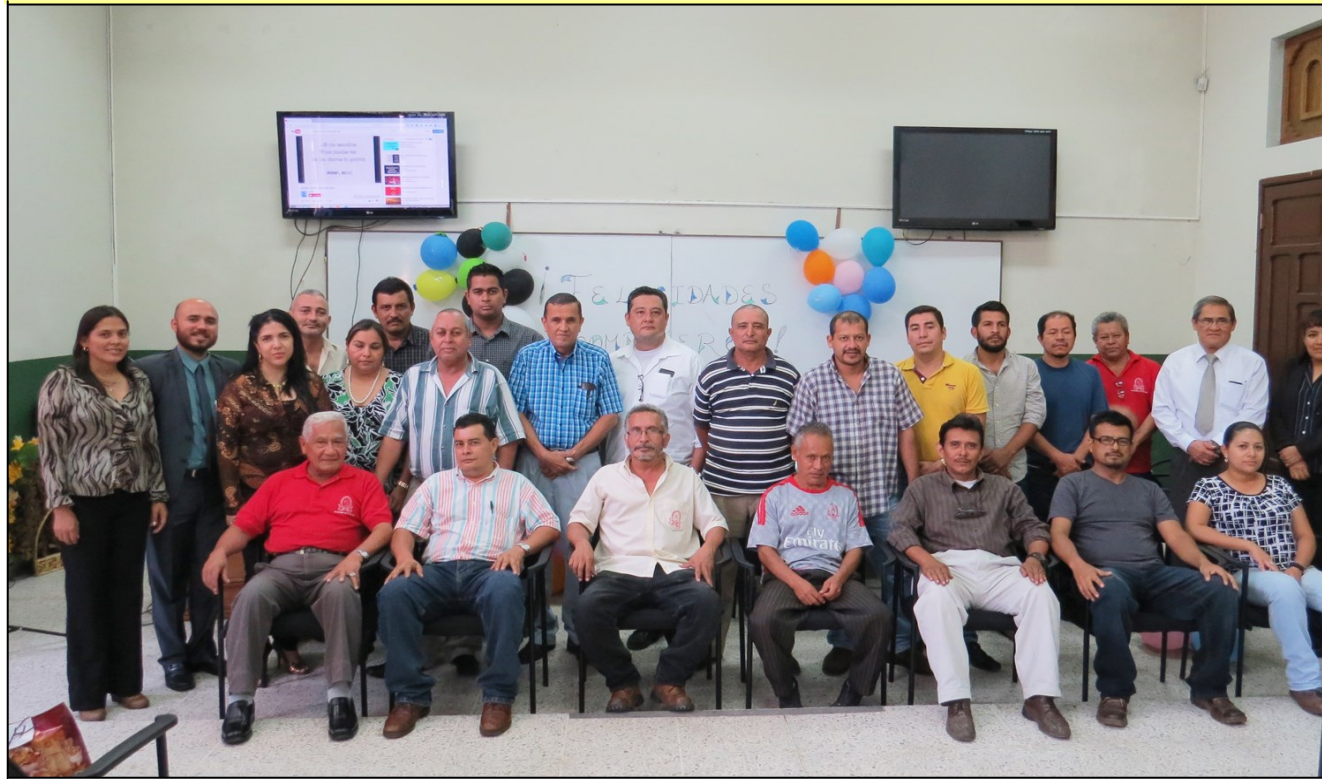
Personal de Servicios Generales junto a Comité de Festejos

E n ambiente de fiesta, camaradería, solidaridad y hermandad, la planta de trabajadores de la Unidad de Servicios Generales de esta