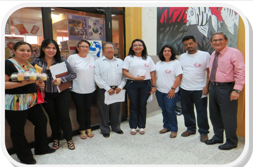
Equipo de trabajo de Biblioteca “Dr. Sarbelio Navarrete” junto a integrantes del Comité de Festejos