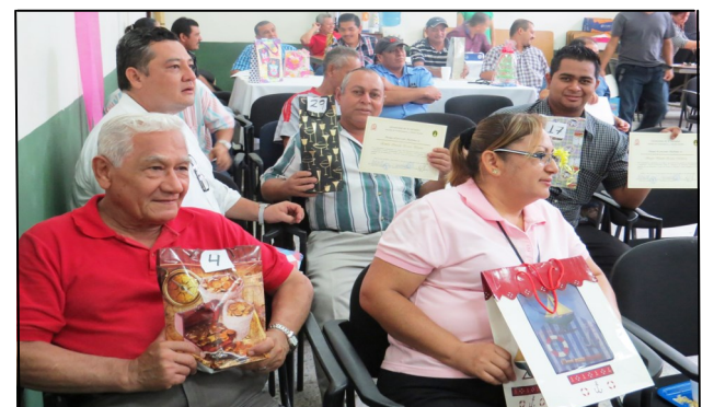
Regalo para cada uno de los trabajadores