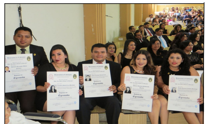
Egresados de Ciencias Jurídicas 2016