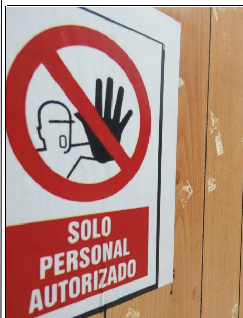
Señalización en colecturía

Brindar condiciones de trabajo seguras y saludables a todos los estudiantes, docentes y personal administrativos, así como a los usuarios de la Facultad de Jurisprudencia y Ciencias Sociales, es el objetivo que persigue el Comité de Seguridad y Salud Ocupacional de esta Facultad. En ese sentido y para efectos que se cumpla la Ley General de Prevención de Riesgos en los lugares de trabajo, recientemente se desarrolló una Jornada de Señalización en el Edificio Histórico, Edificio “Agustín Farabundo Martí” y el compartido con la Facultad de Economía, para ello, el Comité de Seguridad y Salud Ocupacional contó con el apoyo de estudiantes del Curso Derecho Procesal Penal III, quienes acompañaron la jornada y de esta manera salvaguardar las instalaciones.