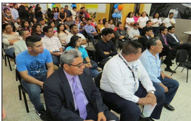
Asistentes en la Feria del Libro