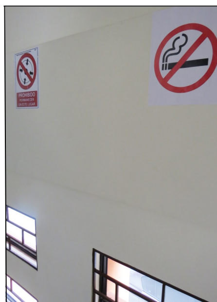
Edificio “Farabundo Martí”