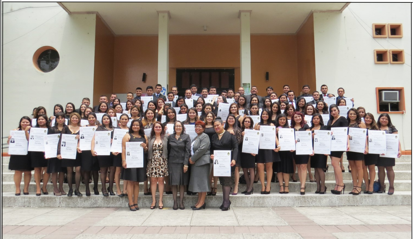
Egresados de Ciencias Jurídicas, junto a Autoridades de la Facultad, frente a la fachada del Edificio Histórico

E studiantes de la Facultad de Jurisprudencia y Ciencias Sociales realizaron recientemente el Acto de Egresados de la Licenciatura en Ciencias Jurídicas 2016, desarrollado en el Auditorio Herbert Anaya Sanabria, al cual fueron invitados autoridades de la Facultad y del país.