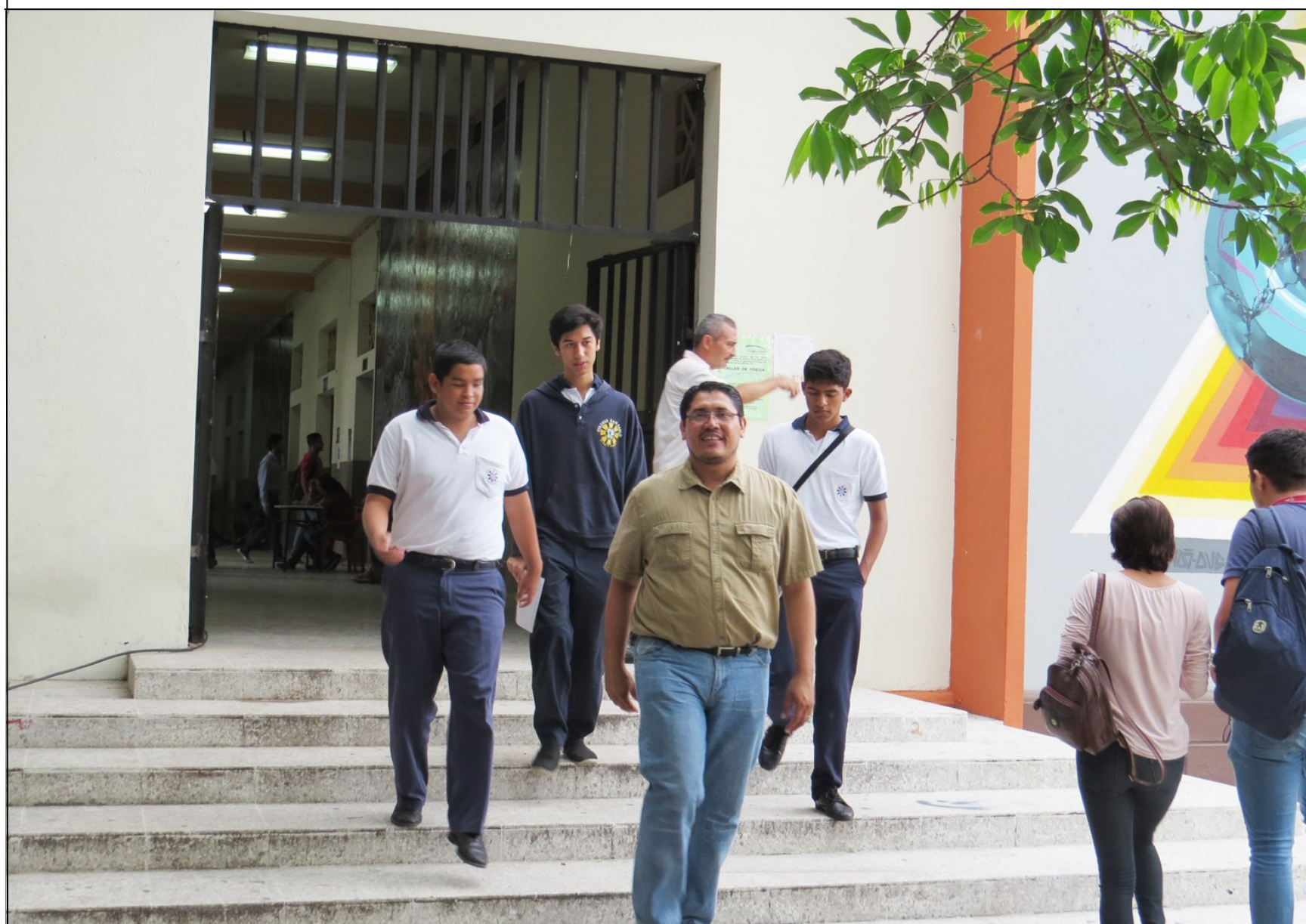
Portón nororiente del Edificio Histórico se ha habilitado para facilitar el acceso de estudiantes y usuarios de esta Facultad

Brindar condiciones de trabajo seguras y saludables a todos los estudiantes, docentes y personal administrativos, así como a los usuarios de la Facultad de Jurisprudencia y Ciencias Sociales, es el objetivo que persigue el Comité de Seguridad y Salud Ocupacional de esta Facultad. En ese sentido y para efectos que se cumpla la Ley General de Prevención de Riesgos en los lugares de trabajo, recientemente se desarrolló una Jornada de Señalización en el Edificio Histórico, Edificio “Agustín Farabundo Martí” y el compartido con la Facultad de Economía, para ello, el Comité de Seguridad y Salud Ocupacional contó con el apoyo de estudiantes del Curso Derecho Procesal Penal III, quienes acompañaron la jornada y de esta manera salvaguardar las instalaciones.