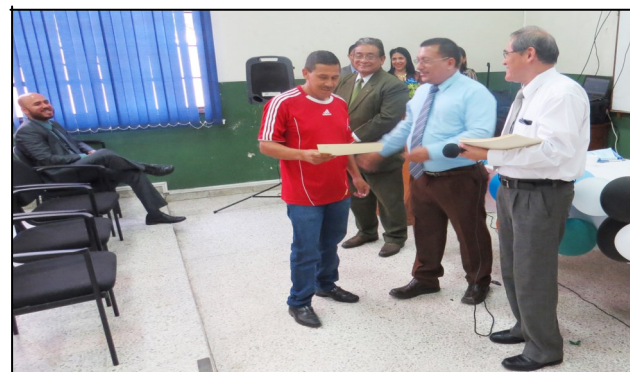
Entrega de diploma por años de trabajo