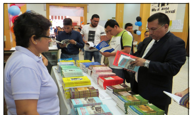
Profesionales y docentes muestran interés en los libros