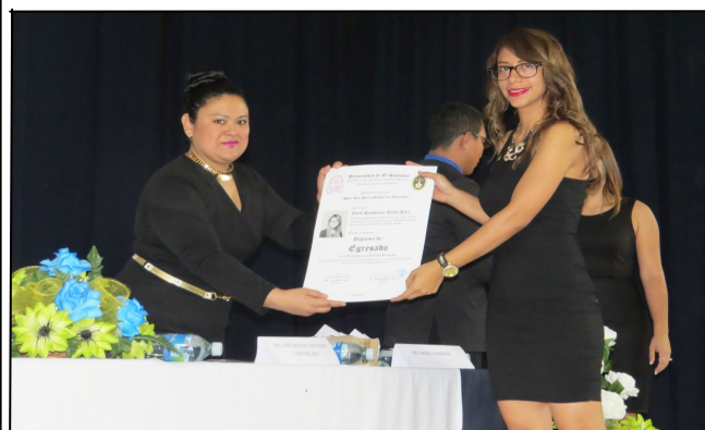
Entrega de diplomas a Egresados